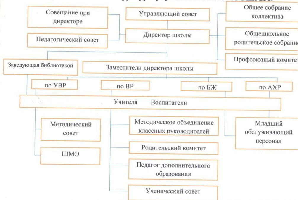
Схема организационной структуры управления МБОУ «ООШ№51»

Выводы об организационной структуре управления учреждения: работа управляющего совета ведется неактивно с педагогическим коллективом, родительской общественностью и администрацией по объединению задач воспитания, обучения и развития учащихся.